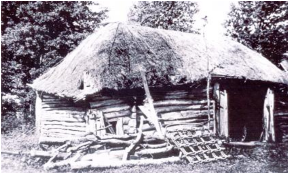
Скотный двор Достоевских, поставленный на месте сгоревшего годом позже. Несомненный его аналог. Конец 80-х гг. – начало 90-х гг. XIX века (датировка автора). Из художественного фонда музея «Зарайский Кремль». Местоположение обозначено на схеме, данной ниже.