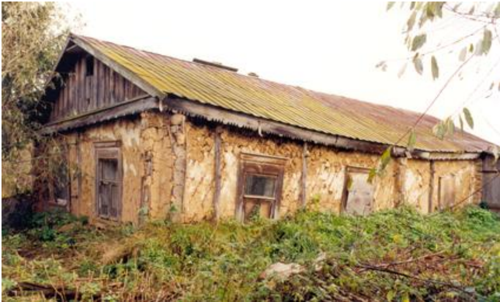
Эта изба в Даровом была снесена последней несколько лет назад. Она поможет оживить детали усадебного флигеля представленного выше.