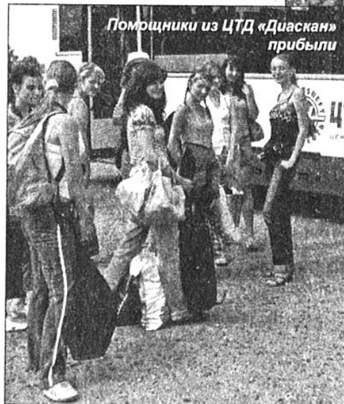
Помощники из ЦТД «Диаскан» прибыли

приходили сюда на воскресную службу, молились, как уходили отсюда просветленными, с надеждой.