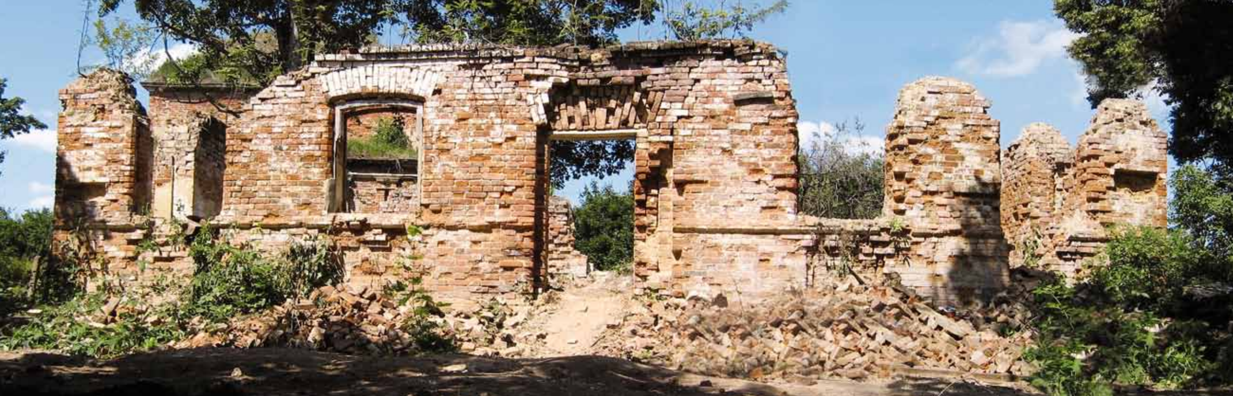
Рис. 28 Церковная школа