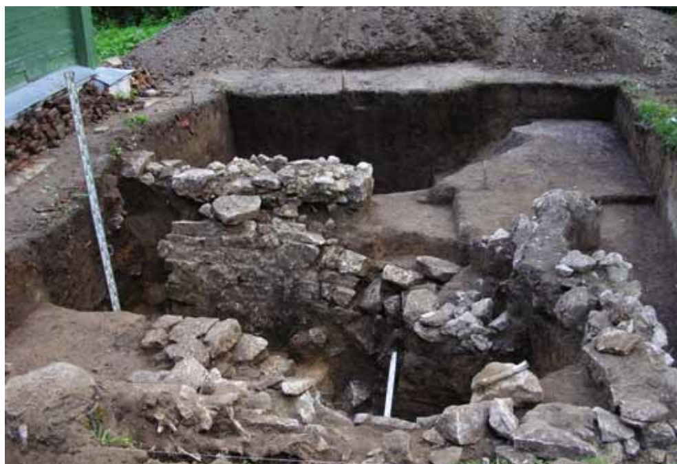
Рис. 4. Раскоп 1 (2005 г.) – расчищенный фундамент «кухни»