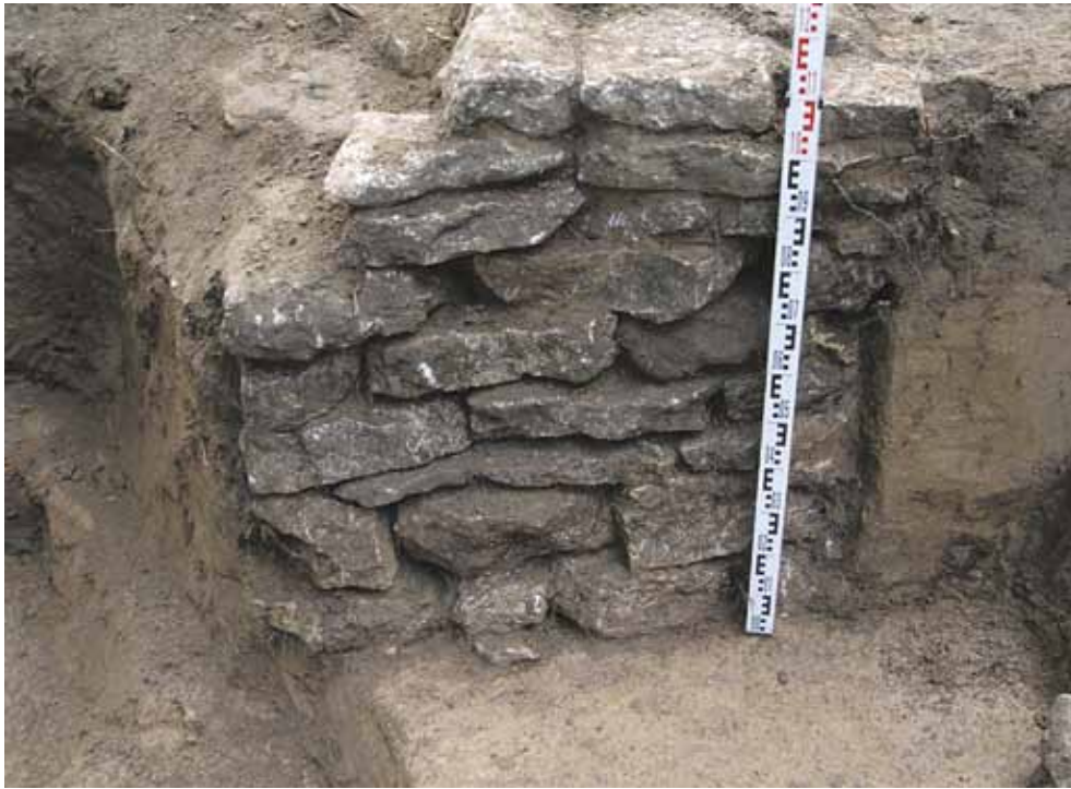
Рис. 5. Подпечный столб в «кухне»