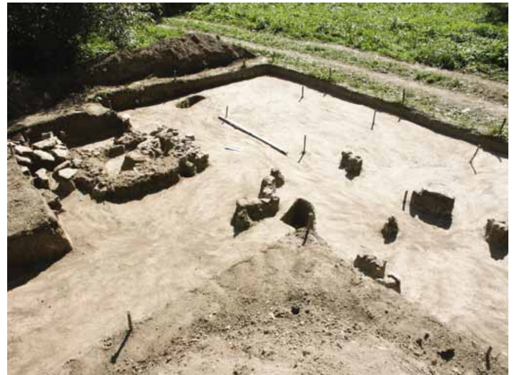
Рис. 25. Остатки фундаментов и основание печи в раскопе 2009 г.