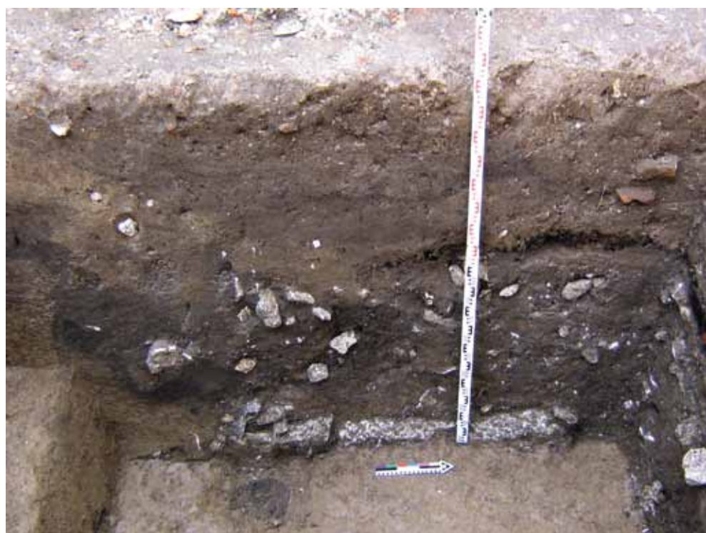
Рис. 29. Западная стенка шурфа