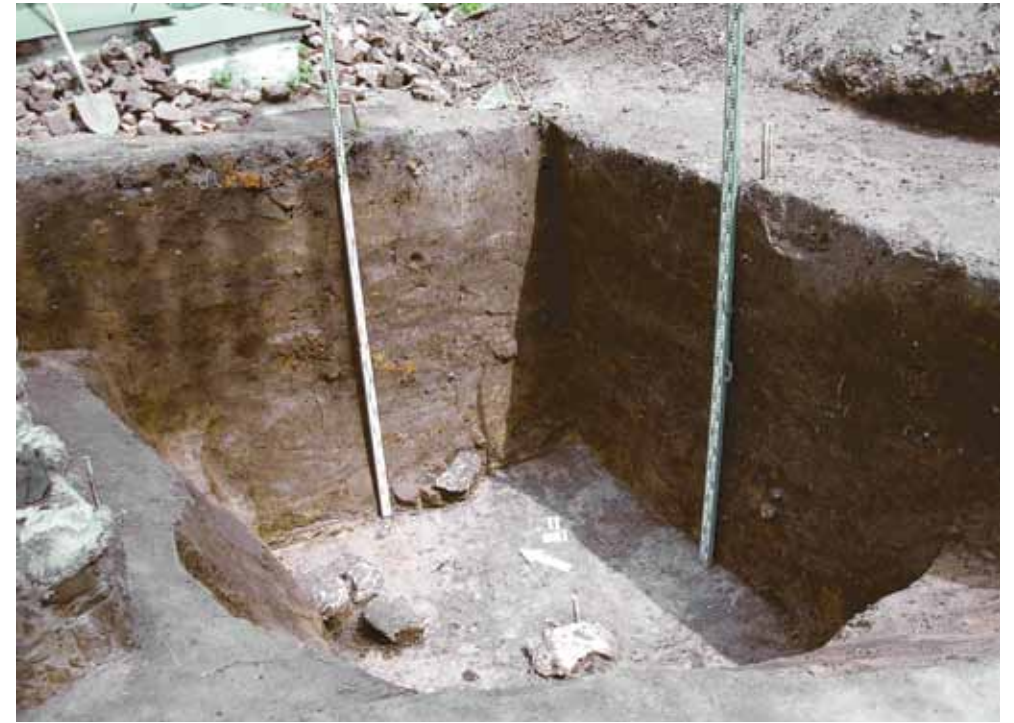
Рис. 12. Расчищенный угол погреба от ранней постройки – яма 1, раскоп 1 (2005 г.)