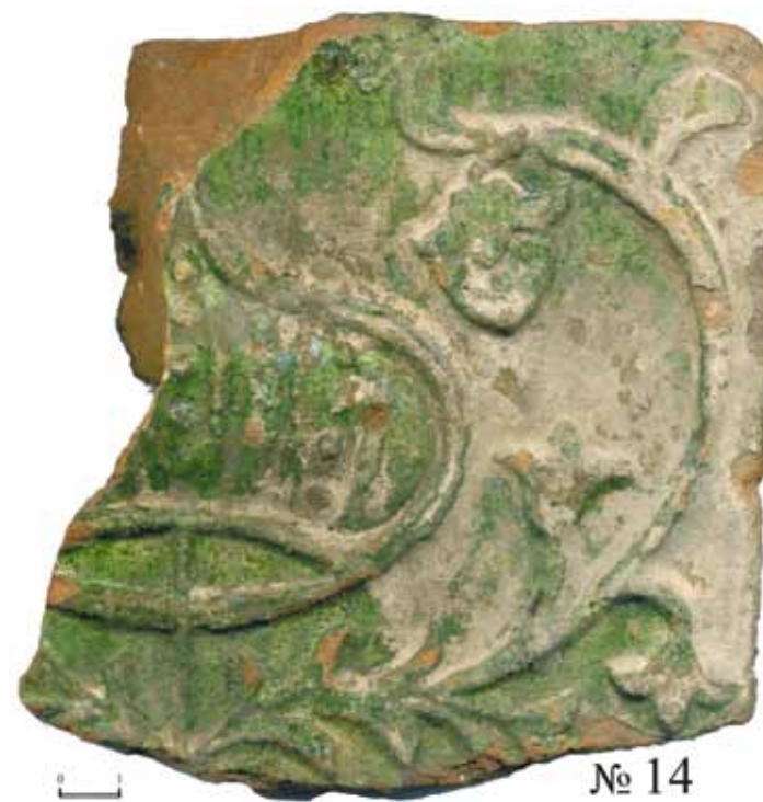
Рис. 30. Зелёный поливной изразец