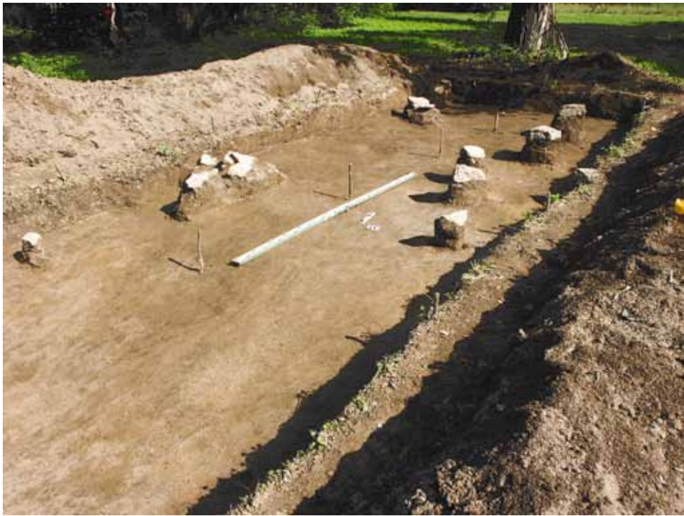
Рис. 23. Остатки фундаментов в раскопе 2008 г.