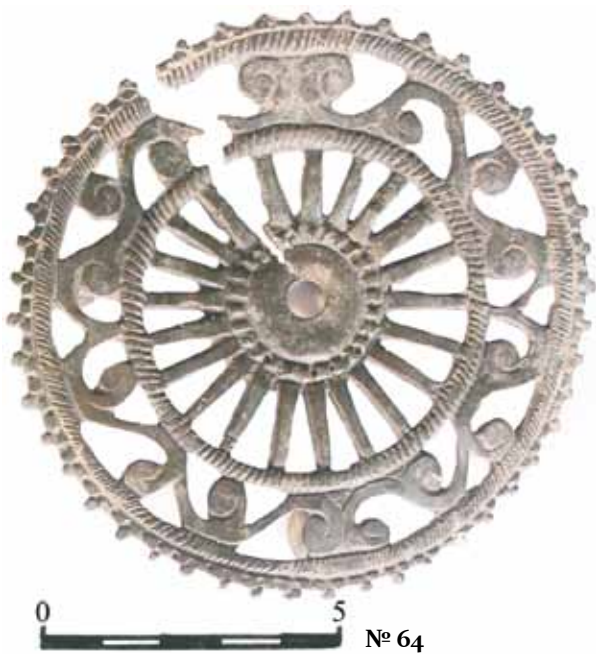
Рис. 10. Изделие медного сплава. Заполнение «кухни», раскоп 1