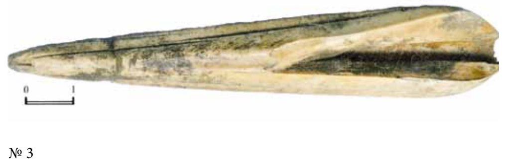
Рис. 27. Находки из раскопа 2009 г. – фрагмент фарфоровой статуэтки? спусковой крючок