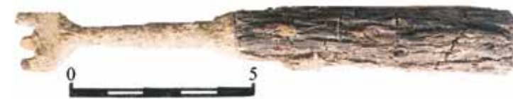
Рис. 15. Вилка с деревянной рукоятью, заполнение ямы 1