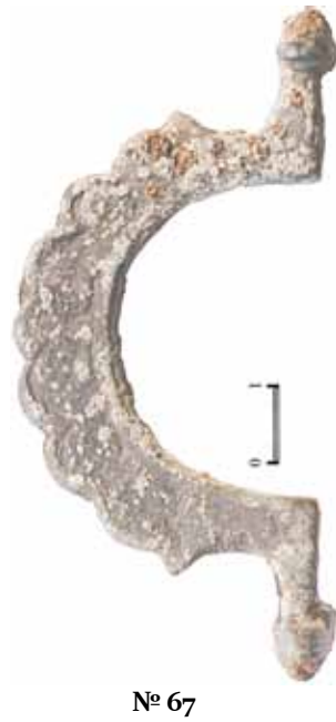
Рис. 11. Ручка сундука (?) медного сплава. Заполнение «кухни», раскоп 1