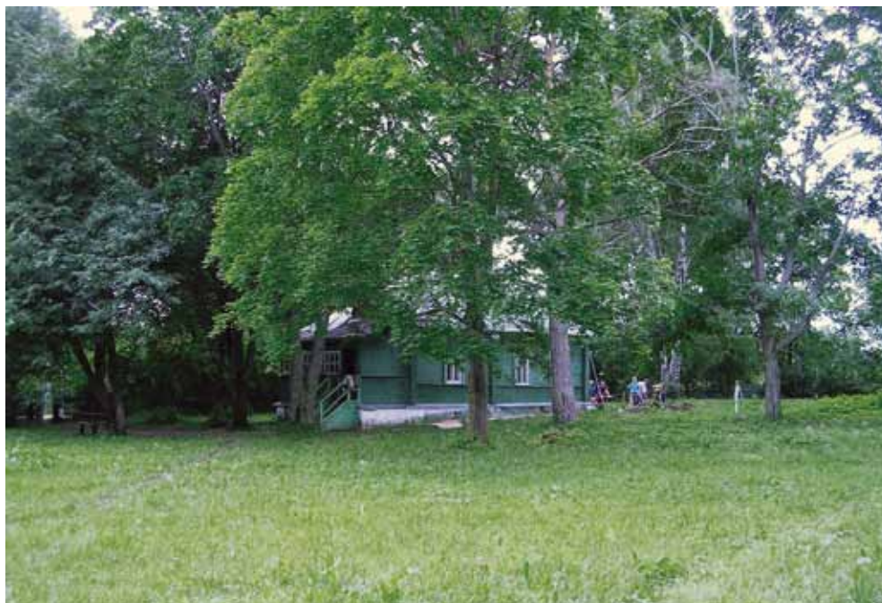
Рис. 2. Современный вид на усадьбу в Даровом